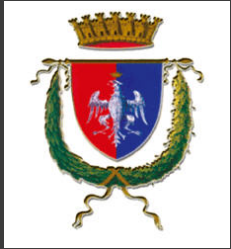
Provincia di Roma